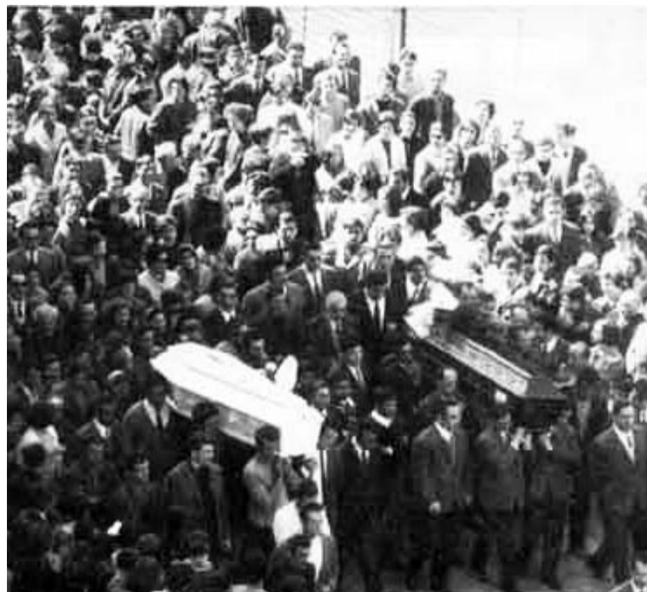
Foto tratta da "La rivolta di Battipaglia" opera di Vincenzo Campagna

Nella tarda mattinata mentre tutto sembrava tranquillo sull'autostrada i celerini attaccarono i manifestanti