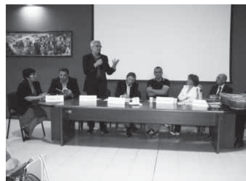
Una recente iniziativa culturale

Credo che la scuola debba rivolgersi prima agli alunni e poi all'ambiente, alla comunità. Credo debba essere un faro della cultura.