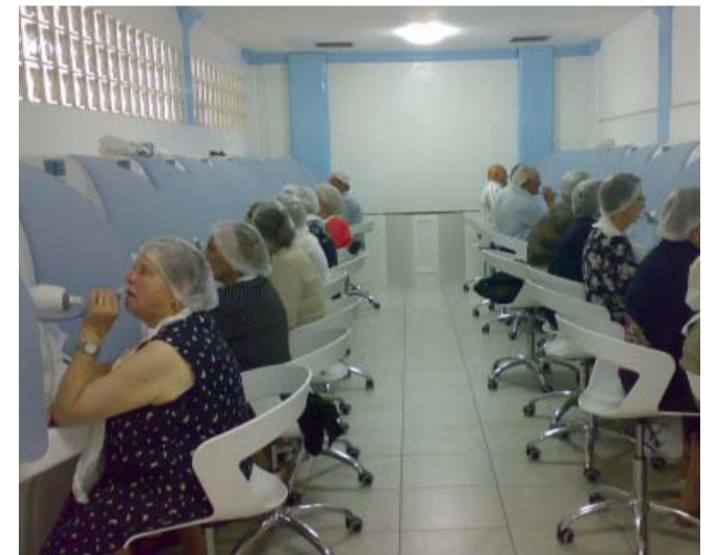
Il reparto inalazioni

equilibrio. Fra gli oligoelementi considerati indispensabili alla luce delle moderne vedute nutrizionali, l'acqua minerale Vulpacchio possiede una buona quantità di litio e di fluoro. Sulla