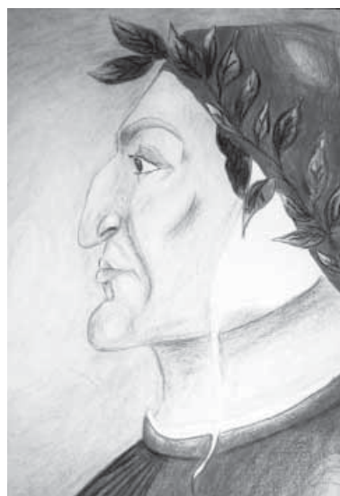
Un lavoro dei ragazzi

Perché riteniamo che la bella prosa e la bella poesia debbano ritornare nella scuola. E anche perché le narrazioni sono sovversive nel senso che mettono la pulce nell'orecchio, creano mondi possibili, speculari o alternativi al reale. E Dante è così. Quando ti dice una cosa riesce anche ad illustrarla, immagini di vederla o di averla vista, anzi la vedi benissimo. Le parole alimentano i sentimenti, fanno lievitare persone migliori. E poi è necessario