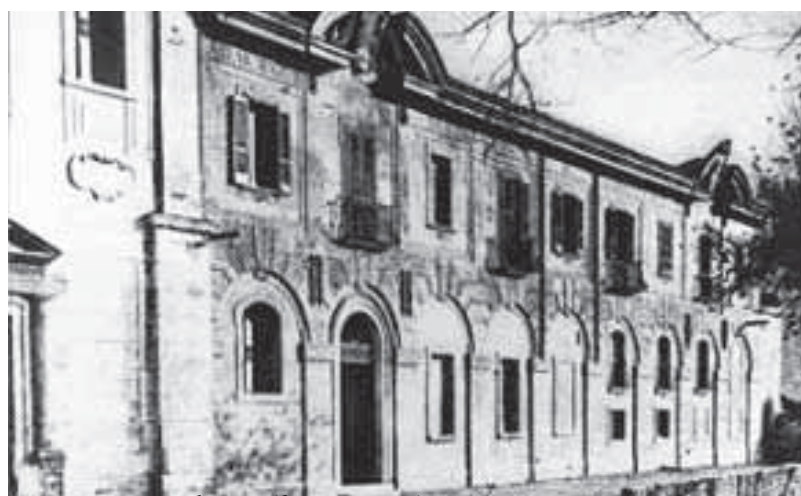
Liceo Artistico Carlo Levi