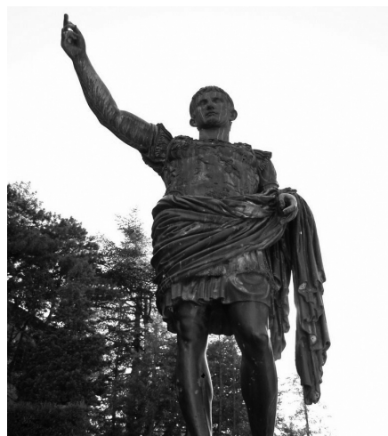
Cesare Ottaviano Augusto

tra di loro, furono tutti intimi amici dell'imperatore e ne condivisero e approvarono le linee guide della politica interna: