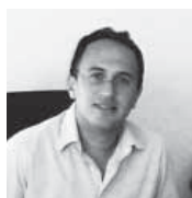
di ANTONIO LUONGO